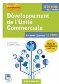
Développement de l'unité commerciale