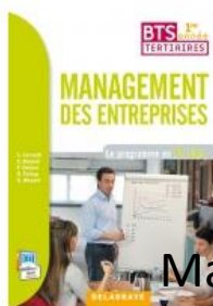
Management des entreprises