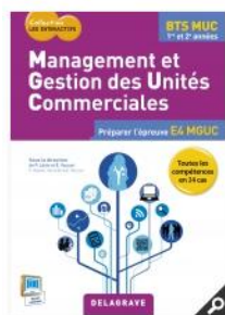
Management et gestion des unités commerciales